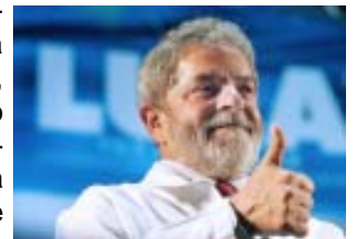
Cara de pau Lula, em entrevista à Folha de S. Paulo: "Só ex-sindicalista pode propor restrição a greves"

Outra promessa de dor de cabeça para os trabalhadores organizados das estatais federais é a intenção do governo federal de restringir o direito à greve dos servidores públicos, anunciada em fevereiro. Mais do que desrespeito à classe trabalhadora, a medida é inconstitucional, fere o princípio do direito à organização e à reivindicação, atacando uma ferramenta de luta histórica e da qual, inclusive, o próprio Lula se utilizou para promover sua carreira política.