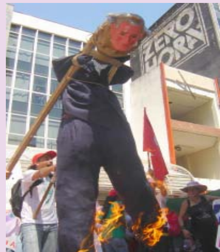
Boneco de Bush foi queimado pelas manifestantes